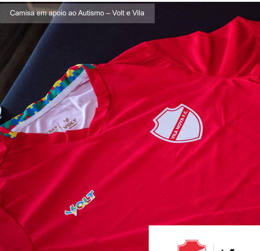
Camisa em apoio ao Autismo – Volt e Vila

O Vila Nova Futebol Clube consolidou uma nova etapa em sua estratégia de material esportivo com a transição da marca própria V43 para a Volt Sport, marcando o fim de uma era e o início de uma parceria promissora. A V43, lançada em 2020 em colaboração com fornecedores como Tommer e Tolledo Sports, e posteriormente com a Super Bolla, foi um símbolo de autonomia e identidade para o clube, trazendo uniformes que celebraram marcos como os 80 anos de fundação em 2023, com designs inovadores como o “Manto da Paixão” e slogans como “Por Dentro Todo Mundo É Vermelho”.